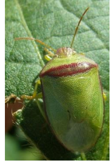
Chinche de la alfalfa

Nº de chinches por metro lineal Umbrales generados con pañó vertical